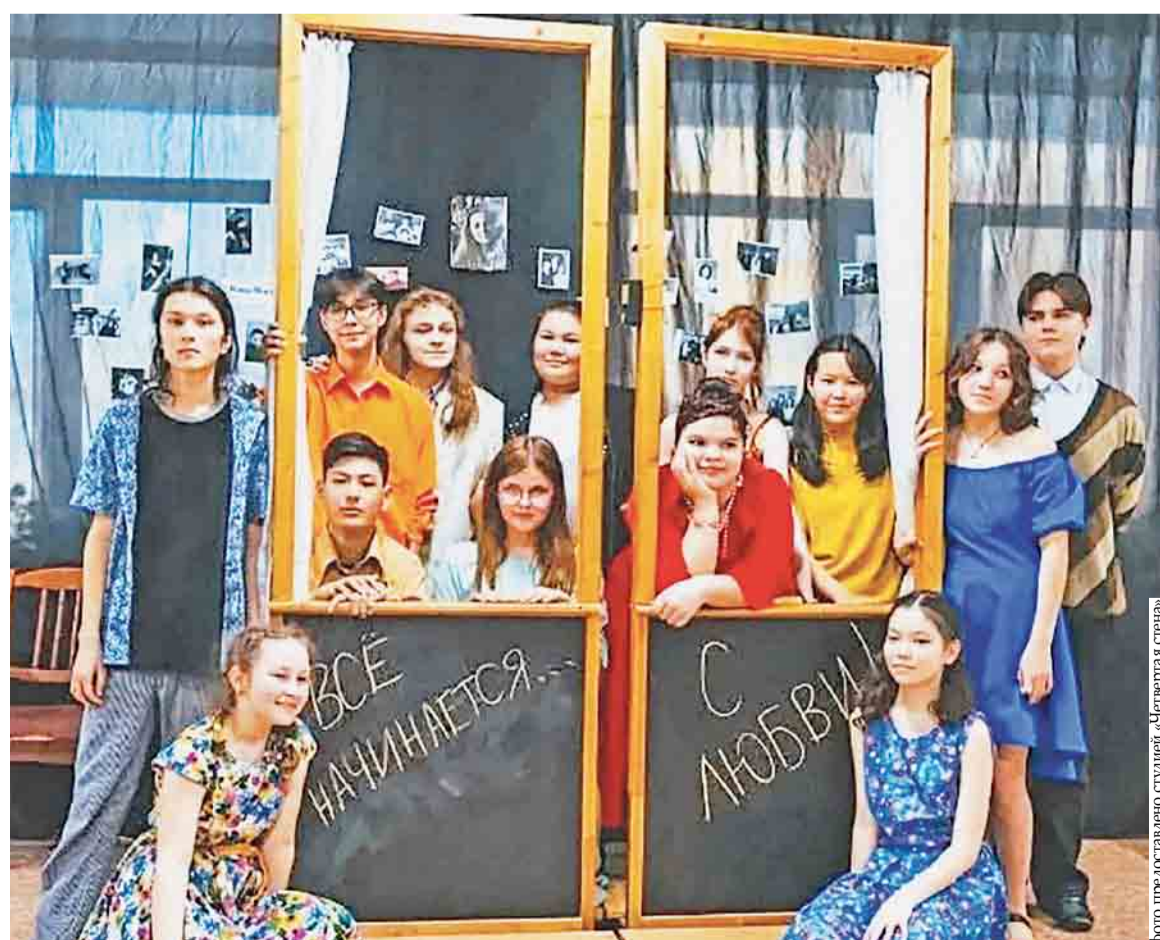
Каждая постановка – маленькая жизнь

Но главным открытием прошлого лета стала плотная коллаборация с другими семьями. Мы сплотились с мамами и папами друзей дочери, создав своего рода «родительский профсоюз». По очереди распределяли обязанности. Одна семья, например, когда позволяет время, берет детей и устраивает пикник на природе. Другие – организуют конкурсы рисунков на асфальте, бои на водных пистолетах, самодельные концерты. И это значительно разгрузило родителей, а главное – дарило ребятишкам настоящее командное лето, где они учились дружить, делиться, вместе исследовать мир.