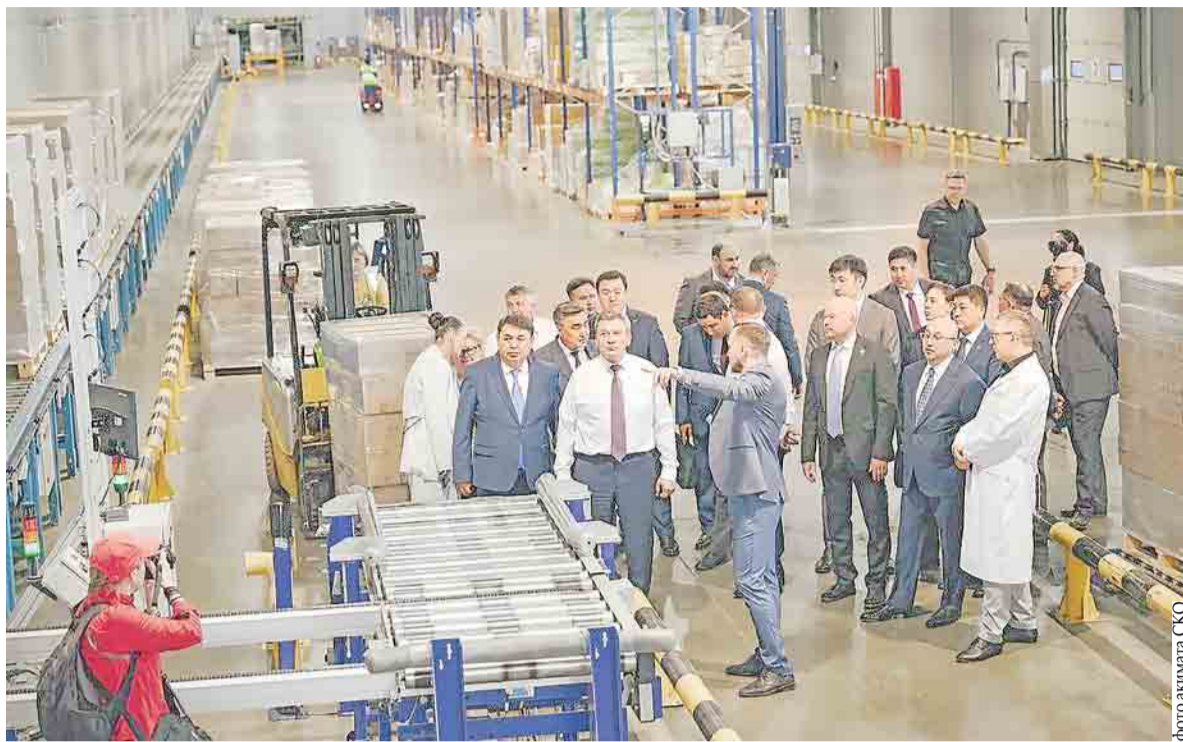
Североказахстанская делегация посетила ряд ведущих предприятий Южного Урала

– Завершение данных проектов имеет важное значение для развития экономики области. Это создание новых рабочих мест, привлечение инвестиций, развитие современной промышленной