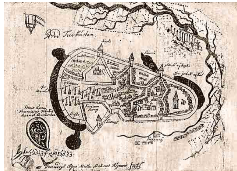
Туркестан на плане окружен стенами с несколькими воротами

Особенность находки в том, что до сих пор практически не было известно планов городов региона, выполненных до эпохи научной картографии. Поэтому эти чер-