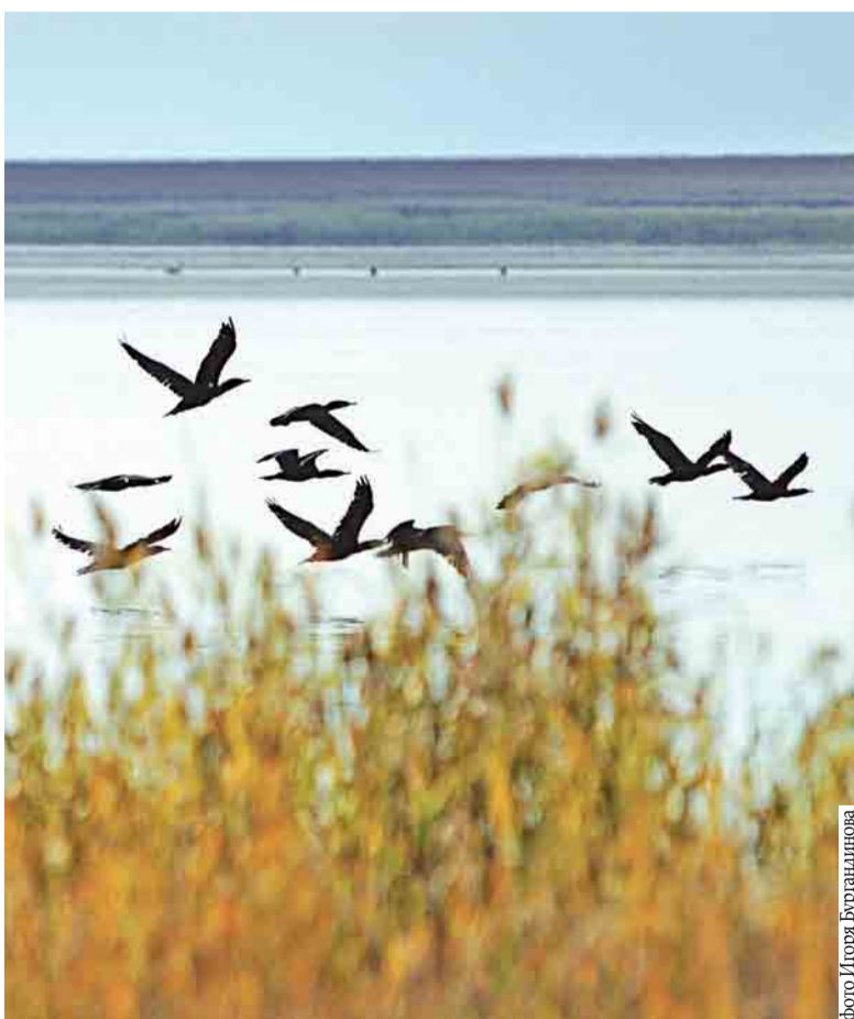
Сеть озер – основа особо охраняемой природной территории

Впрочем, здесь не перестают надеяться на приход молодых. Ждет их благородное дело – защита и изучение родной природы. Хорошо, если эта миссия окажется выше бытовых неудобств. Хочется верить, временных.