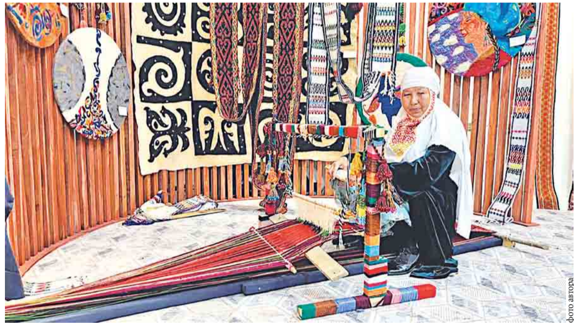
Продемонстрировано традиционное искусство ткачества циновок

Настоящий ажиотаж вызвали фотозоны. Одни фотографировались рядом с ожившими первобытными людьми, дру-