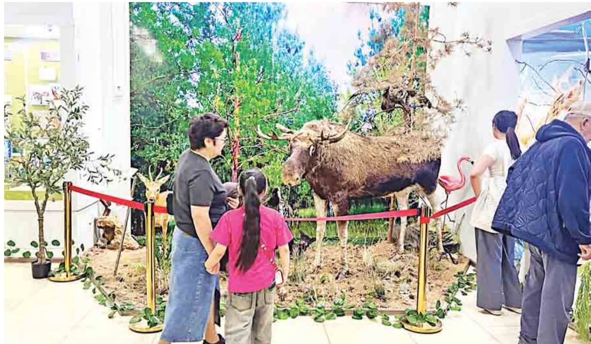
В рамках «Ночи в музее» гости знакомятся с экспозицией представителей животного мира региона

Из его небольшой лекции удалось узнать, что традиции изготовления керамики в Казахстане отличаются в зависимости от региона. Для западных областей характерна терракотовая посуда естественного цвета обожженной глины, а на юге мастера дополнительно расписывали изделия и покрывали их глазурью. По его словам, многое зависит от самой глины, ее состава, пластичности и поведения при обжиге.