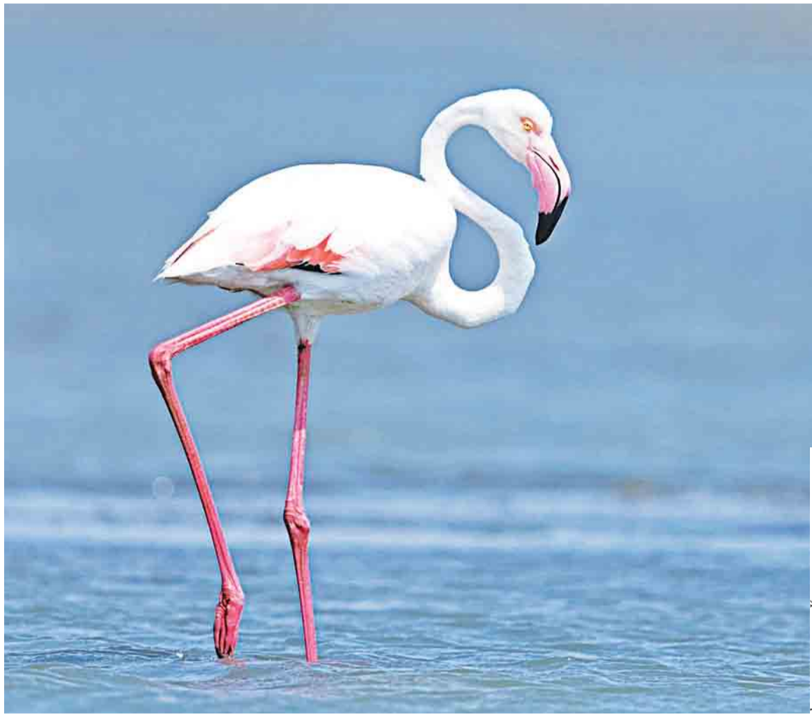
Символ заповедника и Коргалжынского района – фламинго

Существует легенда о том, что в голодный год фламинго выклевали из своей груди кусочки плоти и бросали ее голодным собратьям. Оттого, мол, кровью окрасила их оперение... Но в действительности фламинго