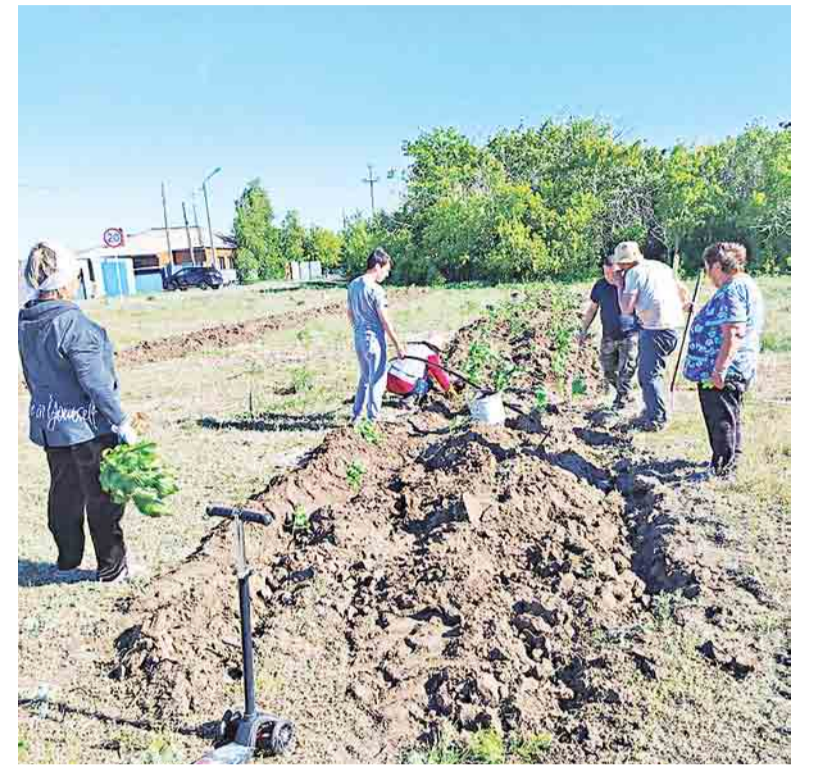
Кеменгерцы стараются украшать свое село

Кроме того, продолжается строительство второго предприятия этой отрасли – маслоэкстракционного завода ТОО «Jielong Holdings (Kazakhstan)» с участием прямых иностранных инвестиций. После ввода в эксплуатацию, что намечено на будущую осень, предприятие сможет перерабатывать до 120 тыс. тонн семян подсолнечника в год и создаст не менее 80 постоянных рабочих мест.