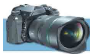
Фотомиг Игоря Бургандинова