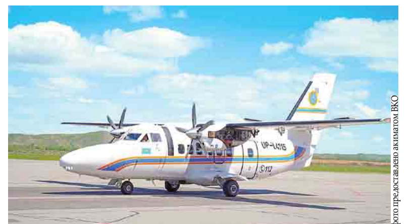
Легкий самолет предназначен для работы в чрезвычайных ситуациях

– Область заинтересована в запуске субсидируемых авиарейсов из Усть-Каменогорска в Актау, Атырау, Актюбе и Туркестан, – подчеркнул глава региона. – По оценкам экспертов, реализация проектов придаст дополнительный импульс развитию внутреннего и въездного туризма, пассажиропоток возрастет с 700 тысяч человек до 800 тысяч.