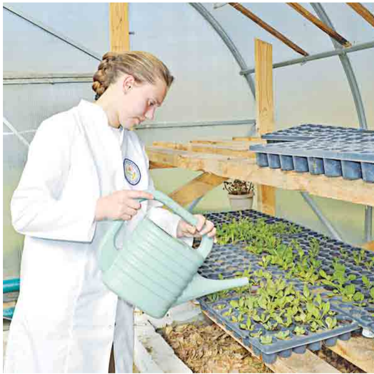
Погружение в профессию студентов агроколледжа

Другим важным направлением стала селекционная работа с крупным рогатым скотом. Вместе с преподавателями студенты участвуют в проектах по улучшению местного поголовья с использованием генетического материала казахской белоголовой породы: