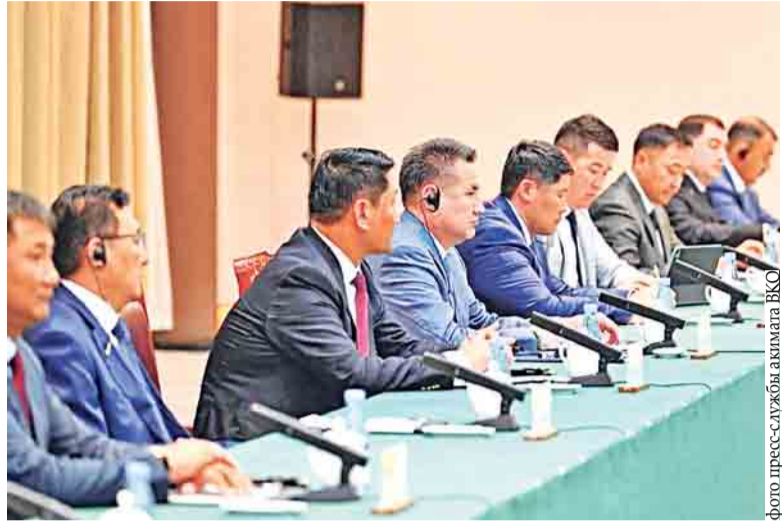
Туризм стал ключевой темой рабочего визита в КНР