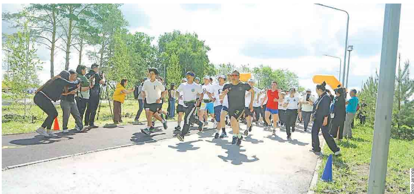
Более 300 мужчин и женщин вышли на утреннюю пробежку

– Я бы оценил забег как дистанцию средней сложности. Есть большие проблемы с погодой, очень жарко с самого утра, но в целом все отлично. Я надеялся на победу и одержал ее. Специально не готовился, да и вообще в марафоне участвую впервые. Но мно-