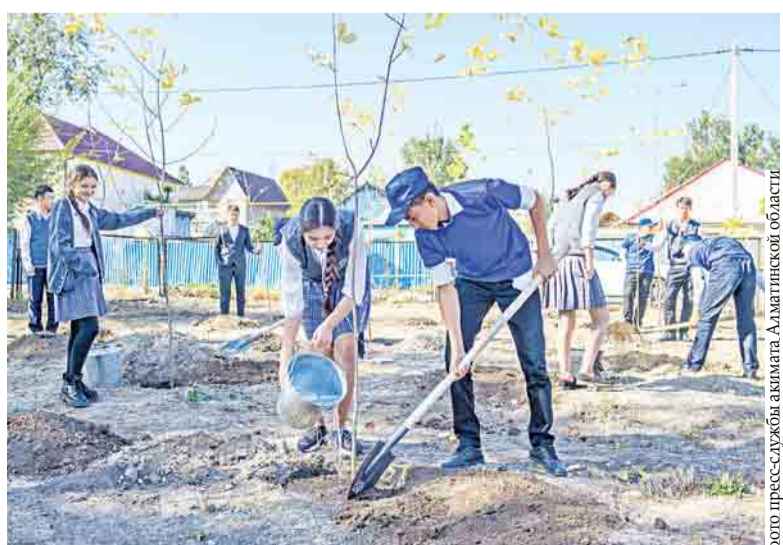
Акция «Посади дерево» охватила весь регион

По данным акимата области, нынче на санитарную очистку загрязненных зон из местного бюджета выделено 1,5 млрд тенге. С начала года в субботниках приняло участие более 300 тыс. человек, на санитарные полигоны вывезено свыше 7 тыс. тонн мусора. Отдельное внимание уделяется озеленению населенных пунктов: высажено более 100 тыс. деревьев, разбито 20 экопарков.