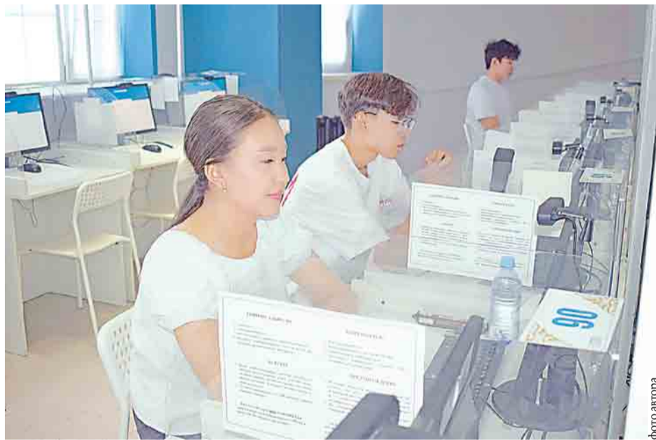
Абитуриенты сдают три обязательных и два профильных предмета

В эти дни повсеместно проходит единое национальное тестирование