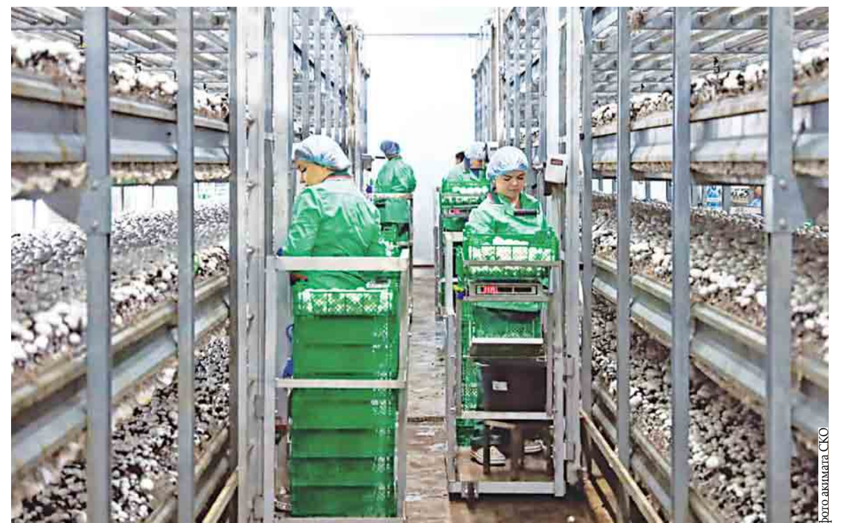
Производство грибов выстроено как замкнутый технологический цикл

Значительный блок развития СЭЗ связан с пищевой промышленностью. Так, ТОО «Бейкертон» реализует крупный проект по выпуску хлебобулочных изделий длительного хранения.