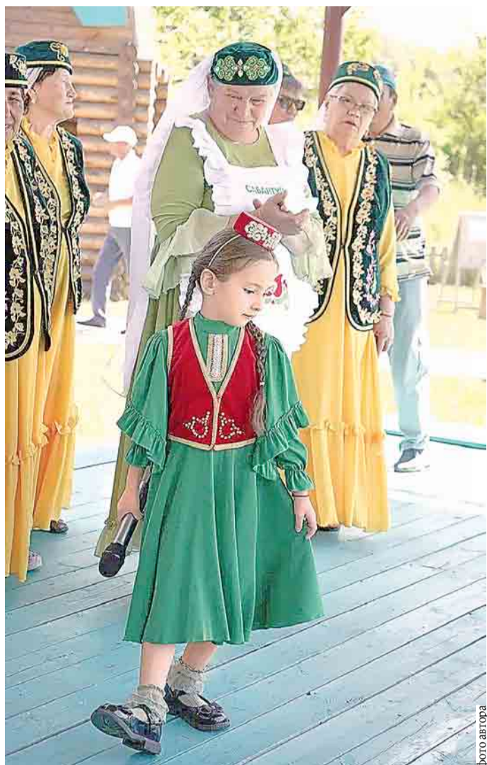
Яркие выступления никого не оставили равнодушными