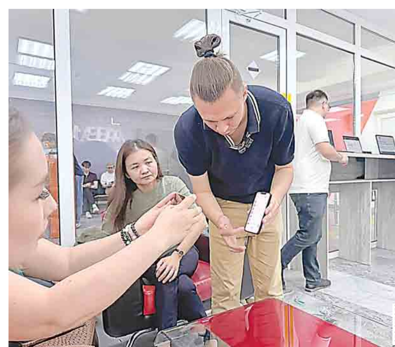
Цифровая платформа учитывает рабочее время

Завершил экспозицию стартапов Jidek.kz – цифровая платформа карьерной навигации. Анализ рынка труда, поиск вакансий и образовательных возможностей, построенные на реальных данных, помогают пользователям выбирать востребованные профессии и строить успешную карьеру.