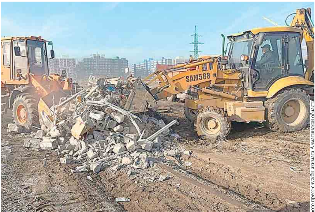
Ликвидируют стихийный полигон

Обратившись за помощью к журналистам одного из телеканалов, сельчане рассказали, что задыхаются от зловония, исходящего свалкой. По их словам, чего там только нет: помимо бытовых отходов и мебели, сбрасывают химикаты и даже туши мертвых животных. Нередко мусор поджигают, тошнотворный дым проникает в дома даже сквозь закрытые форточки.