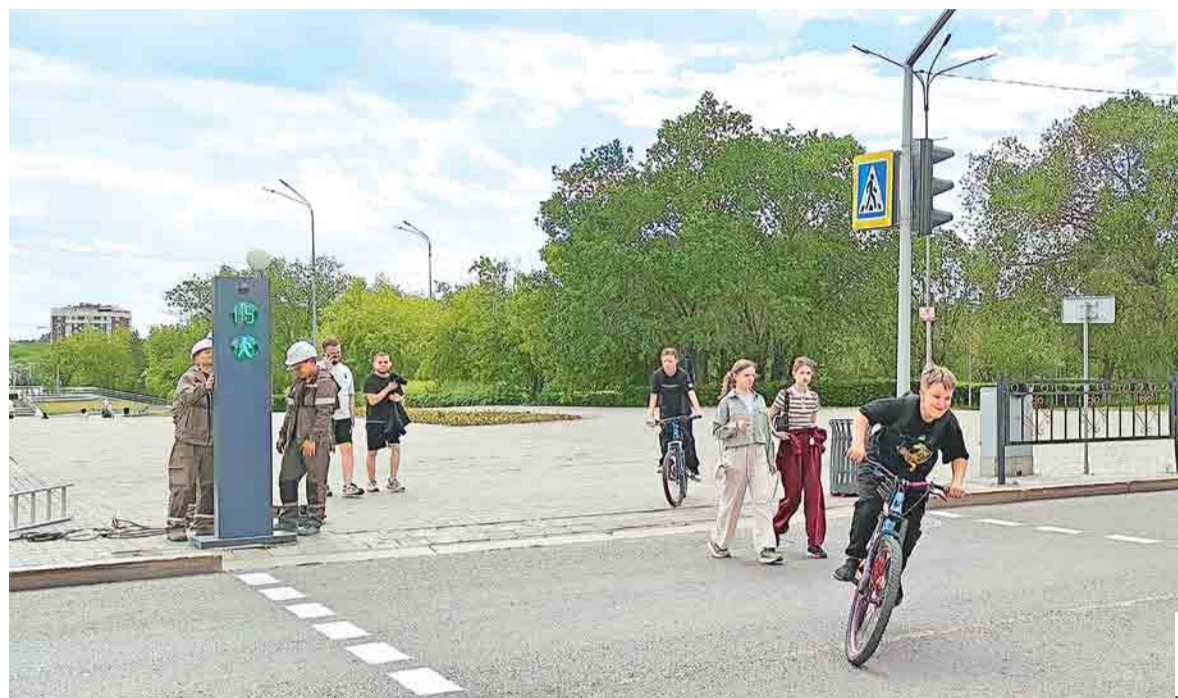
Умный пешеходный переход может обнаруживать людей, находящихся в розыске

Пока умные пешеходные переходы работают только в режиме фиксации. Они «высматривают» беглых преступников и злостных должников, с которыми потом работают правоохранители и судебные исполнители. А вот нарушителям Правил дорож-