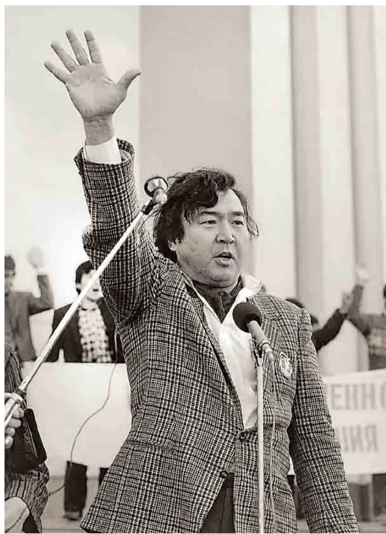
Жест, символизирующий протест против работы пяти ядерных полигонов планеты

Позже я интересовался: «Что же вы не следите за своим печатным органом? Разве Центральный комитет хвост, чтобы им крутить?»