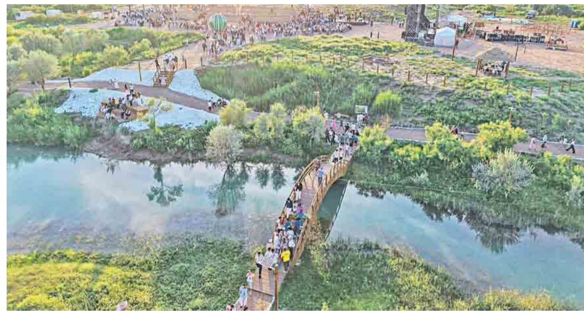
Экопарк вырос вокруг степной реки Карашик

...Через несколько лет деревья подрастут, аллеи укроются густой тенью, а первые посетители уже не вспомнят, что когда-то здесь был пустырь. Но именно такие перемены и становятся настоящей летописью города – не в официальных отчетах, а в повседневной жизни людей.