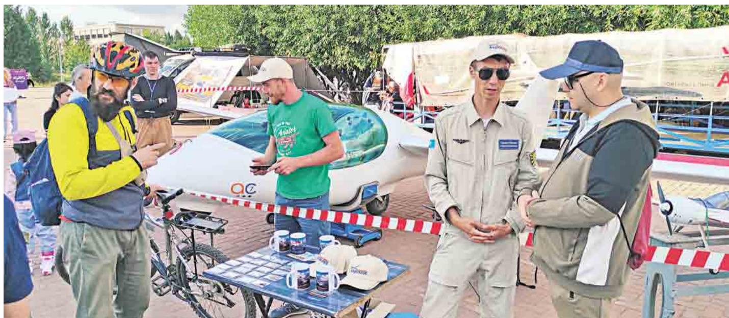
В числе клиентов уральского аэроклуба – отдыхающие со всего Западного Казахстана, а также приграничных городов РФ