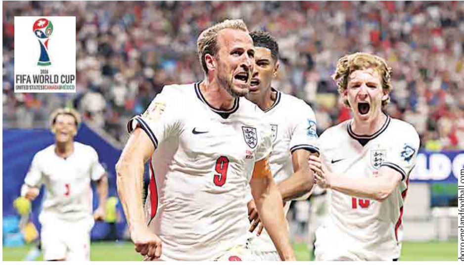
Дубль Гарри Кейна выводит Англию в следующий круг плей-офф

Первыми на поле вышли родоначальники футбола англичане, которые встретились с крайне неуступчивой командой, представляющей Демократическую Республику Конго. Игра проходила в американской Атланте на стадионе «Мерседес-Бенц Стэдиум» в присутствии 68 239 зрителей. Почти все были уверены, что британцы пусть и не без проблем, но обойдут сборную с Африканского континента. Так и произошло в итоге, хотя все могло быть иначе и гораздо хуже.