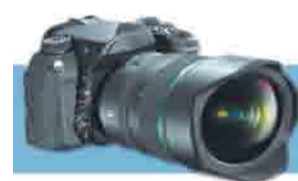
Фотомиг Игоря Бургандинова