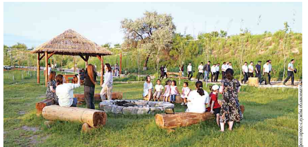
Отдых в экопарке рассчитан на любой возраст

Пожалуй, именно такие проекты лучше всего показывают, как меняется Туркестан. Долгое время древний город ассоциировался прежде всего с мавзолеем Ходжи Ахмеда Ясауи и паломничеством. Сегодня к этому добавляется совершенно другой образ – современного, благоустроенного областного центра, где появляются новые жилые кварталы, школы, спортивные объекты,