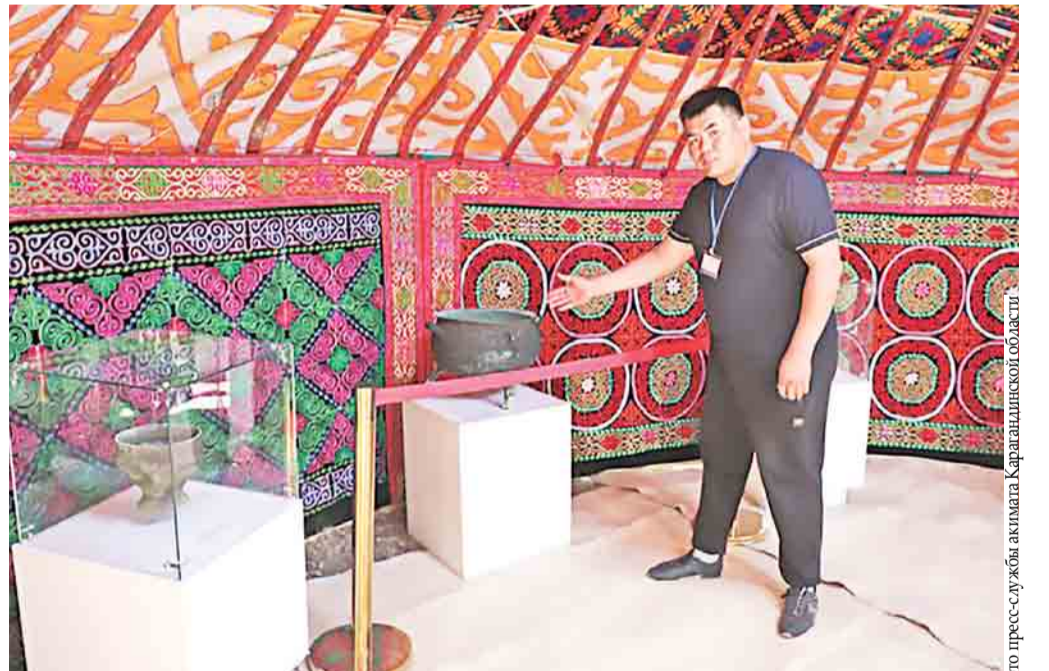
Сейчас артефакты из сакских курганов хранятся в краеведческом музее

Другой бесценный артефакт сакской эпохи – железный топор – был найден в 2020 году во время раскопок большого курга-