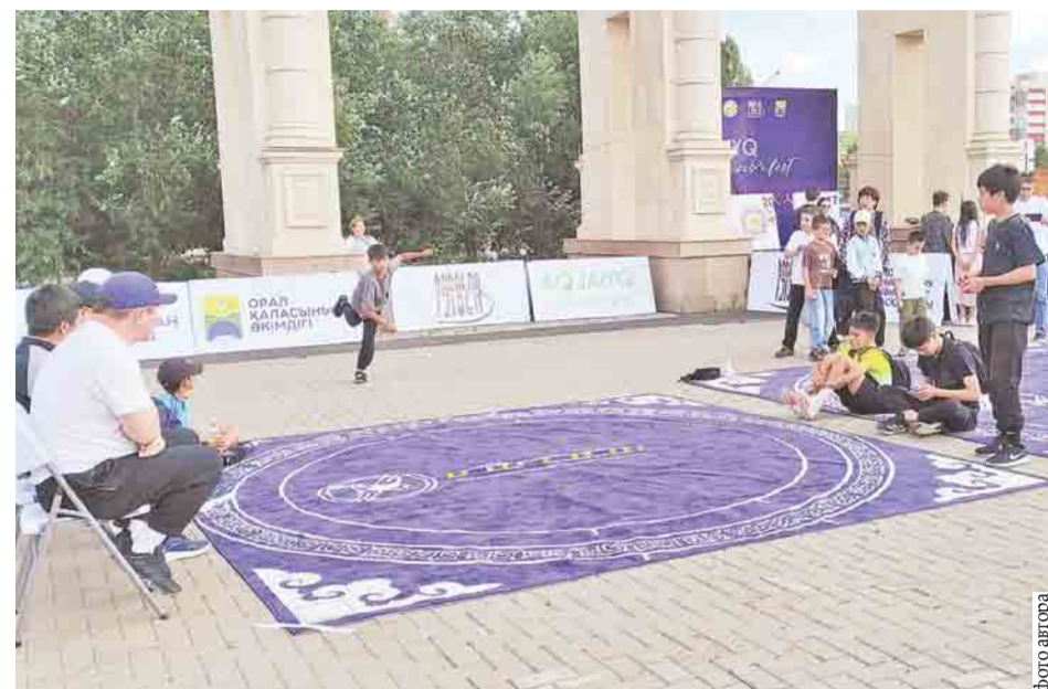
Соревнования по национальным видам спорта уже привлекают внимание зарубежных туристов