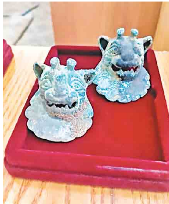
Считается, что протомы в виде барсодраконов были частью конского снаряжения

Был изучен и сам кызылжартаский котел. Микронзондовый анализ показал, что он отлит из меди чистотой 99% с незначительными примесями олова и железа. Ученые отнесли котел к семиреченскому типу и сделали вывод о том, что он появился в степях Сарыарки в результате откочевки части позднесакского населения из Семиречья во II веке до н. э.