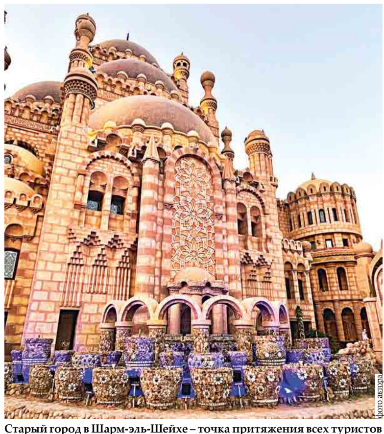
Старый город в Шарм-эль-Шейхе – точка притяжения всех туристов

Тем не менее эксперты уверены: интерес казахстанцев к путешествиям будет только расти. Причем как к зарубежному отдыху, так и к внутреннему туризму, который в последние годы постепенно превращается в полноценную и конкурентную отрасль.